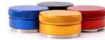
Niveladores de café