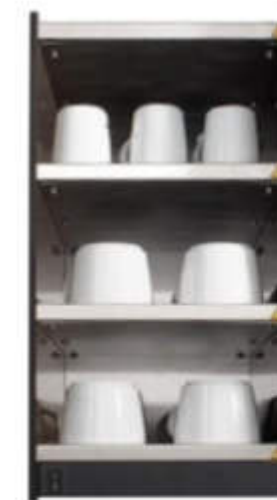
Calienta tazas profesionales