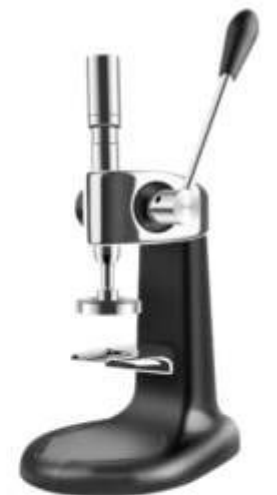
Prensas de café dinamométricos