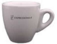
Tazas de café