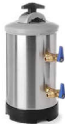
Depuradores de sal (8L y 12L)