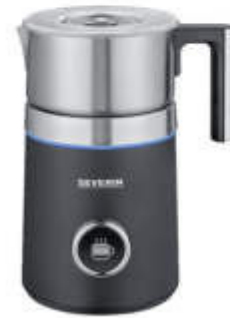
Emulsionadores de leche