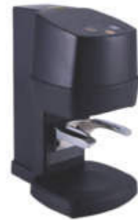
Prensas de café automáticos