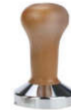
Prensas de café manuales