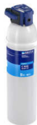
Depuradores de cartucho (Brita y H2O Direct Microfilter)