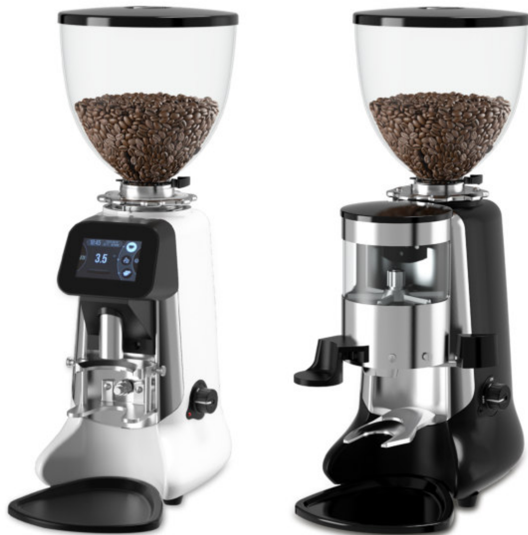
BUDDY E (ON-DEMAND)

BUDDY-D CON DOSIFICADOR Y BUDDY-E CON SISTEMA ELECTRÓNICO ON-DEMAND. AMBOS MODELOS CUENTAN CON FRESAS DE ACERO TEMPLADO DE ALTA CALIDAD FABRICADAS POR MAHLKÖNIG Y UN SOPORTE PORTA-FILTRO UNIVERSAL PARA MAYOR COMODIDAD.