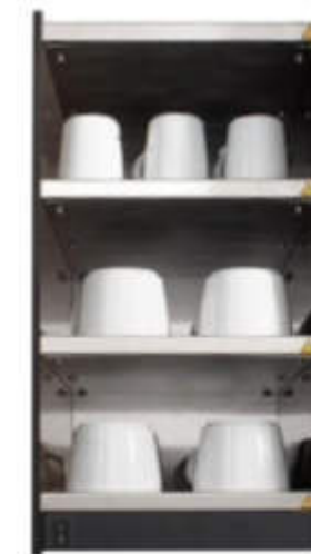
Calienta tazas profesionales