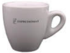
Tazas de café